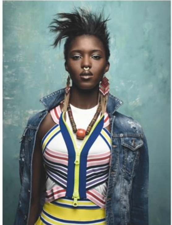
À gauche : veste en Nylon, KARL LAGERFELD . Bouton-gorge en cuir, ZARA BAYNE . Pantalon en denim, ROBERTO CERVELLI . Châleux dans les cheveux et autour du cou, SAPP'S . Bagues, CORPUS CHRISTI . Montres, BIJOUX . Collier et chaussures, GIUSEPPE ZANOTTI DESIGN . Ceinture et signe de nez vintage. À droite : veste en jean, débardeur en coton et robe multicolore en coton stretch, DIAGRAMME . Collier, CÉMARÉ . Bouton de vêtements vintage.