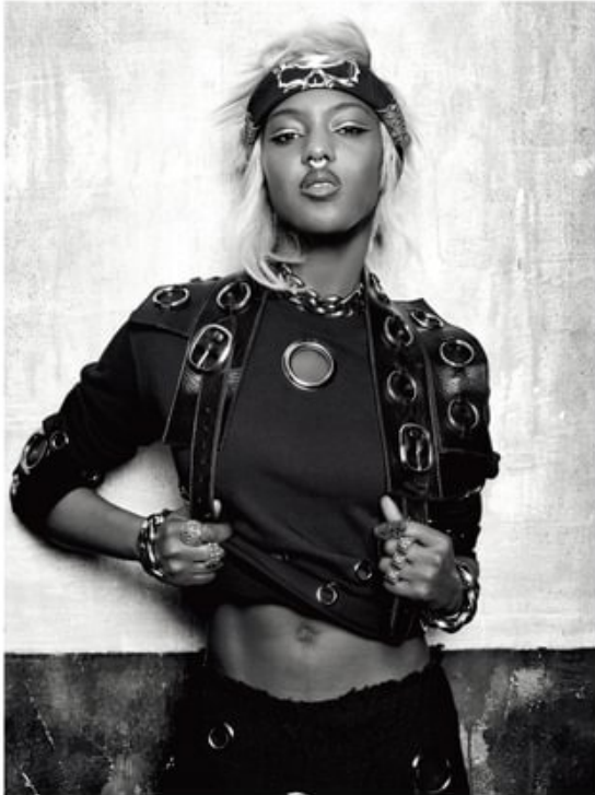
Swear! shirt en coton et métal, et jupon en laine et métal, WIGWAG . Boutefeu, ZARA BAYNE . Collier et bracelets, GIUSEPPE ZANOTTI DESIGN . Bagues, CHRISTINE HEARTS . À droite : veste bicolor en pyllon et jupon en cuir frangé, REDEMPTION . Haut de maille, AMERICAN APPAREL . Colliers, CÉMARÉ . Bracelet à gauche, ALEXIS MARILLÉ et à droite, POGG . Bouton, NICK OWEN . Signe de nez et ceinture vintage.