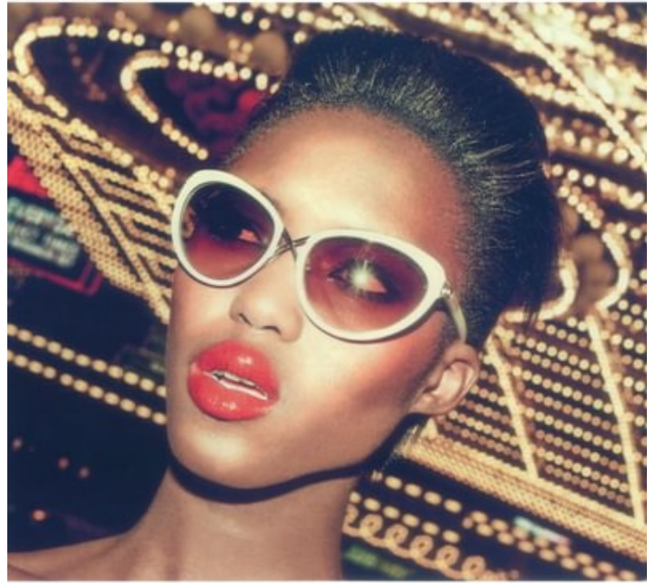
TIM FORD "Charlie" sunglasses in shiny ivory acetate with shiny pale gold metal detailing and gradient lenses. Italy. $450. Main Floor. XI.com