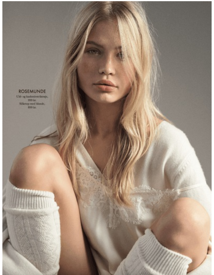
ROSEMUNDE Ud- og kadedstrøktøj, 999 kr. Sjalarup med blænde, 899 kr.