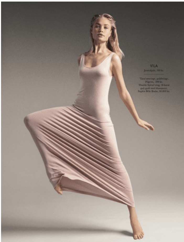
VILA Jærskjole, 160 kr. *Tata/ærring, guldring, Pigriin, 299 kr. *Dovler Rymil/ærring, 18 karat guldt med diamanter, Sophie Blåe Børst, 30.000 kr.