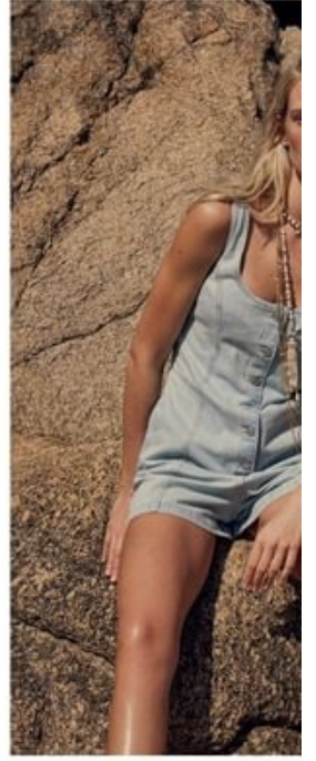
Salopette Lewis / col. blu. Pantalone Chama