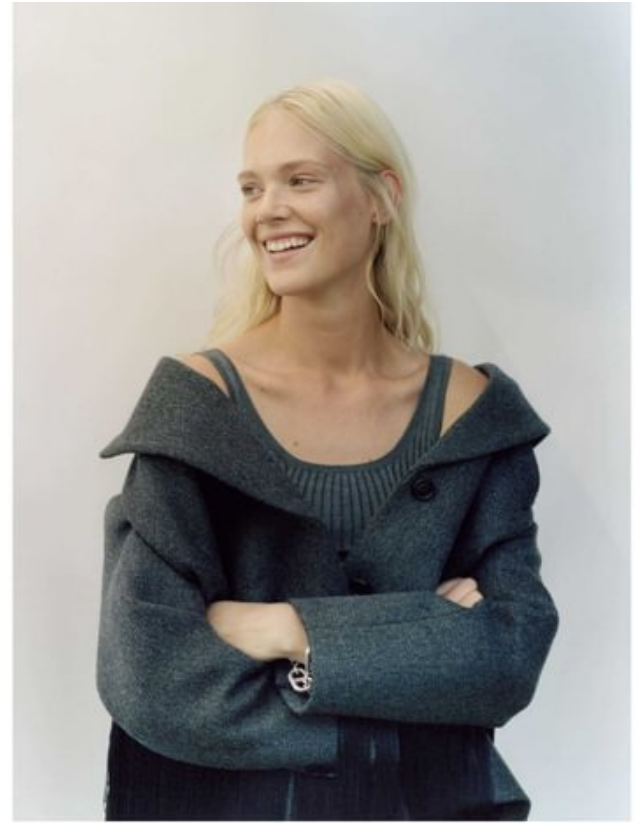
Oben: Blazer mit Fransen und BH aus geripptem Cashmere von Prada. Gliederarmband von Hermès. Links: Rollkragenpullover von Joseph. Hut von Jil Sander über Mytheresa.