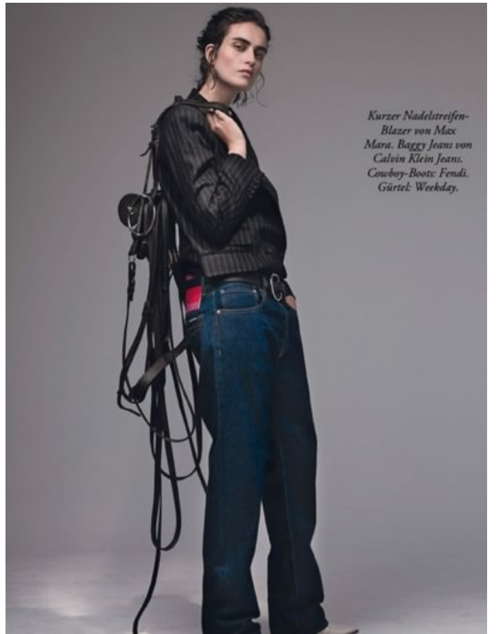
Kurzer Nadelstreifen- Blazer von Max Mara. Baggy Jeans von Calvin Klein Jeans. Cowboy-Boots: Fendi. Gürtel: Weekday.